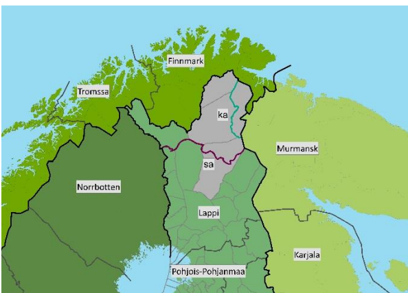
Kuva 1. Pohjois-Lapin maakuntakaava-alue ja vaikutusalueet.

Lapissa maakuntakaavoitus etenee osa-alueittain. Pohjois-Lapin maakuntakaava-alueeseen kuuluvat Inari, Sodankylä ja Utsjoki. Vaikutusaluetta on Pohjois-Lapin lisäksi koko Lapin maakunta sekä Norjan ja Venäjän lähialueet (Kuva 1). Pohjois-Lapin maakuntakaava-alueesta saamelaisen kotiseutualueeseen (Laki saamelaiskärjistä 17.7.1995/974) kuuluvat Inarin ja Utsjoen kuntien alueet sekä Sodankylän kunnassa sijaitseva Lapin paliskunnan alue. Koltta-alue sijoittuu Inarin kunnan itäosaan.