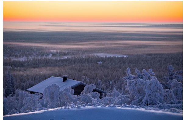
Kuva 3.

Lapin liiton valtuusto päätti kokouksessaan 17.5.2021 palauttaa Pohjois-Lapin maakuntakaavan 2040 uudelleen valmisteluun.