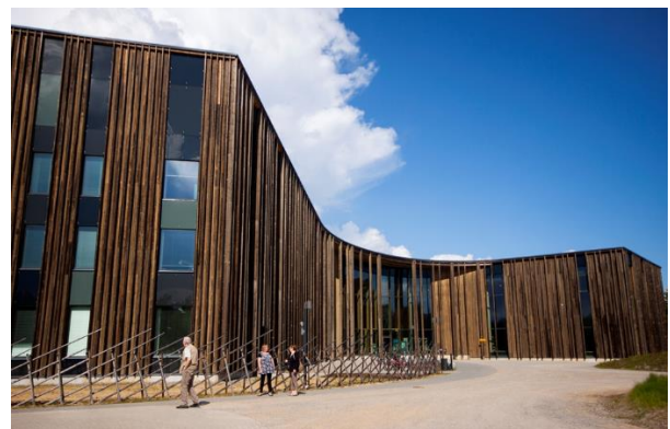
Kuva 4.

Vaikutusten arviointia saamelaiskulttuuriin tehdään Lapin liiton omana työnä niin, että saamelaisia osallistetaan arvioinnin laadinnassa.