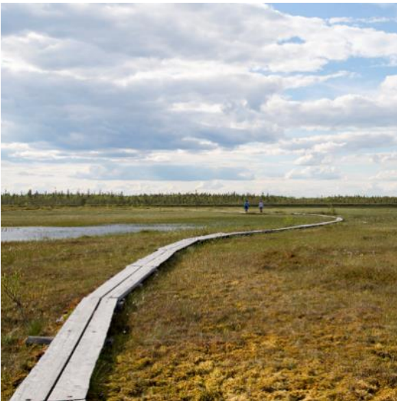
Kuva 4: Aapasuo Sodankylässä

Pohjois-Lapissa poroelinkeino on maankäyttäjää maa- ja metsätalousvaltaisilla alueilla, luontaistalous- ja poronhoitovaltaisilla alueilla, metsä- ja poronhoitovaltaisilla alueilla, erämaa-alueilla sekä suojelualueilla. Poroelinkeinoon harjoittamista ohjaa poronhoitolaki. Maakuntakaavassa poronhoidon toimintaedellytyksiä turvataan ensisijaisesti kaavamääräyksillä, jotka tulee ottaa huomioon alueidenkäytön yksityiskohtaisemmassa suunnittelussa ja toteuttamisessa. Poronhoidon toimintaedellytysten turvaaminen on yksi keskeisimmistä kysymyksistä, kun metsien monikäyttöä eri tasoilla suunnitellaan.