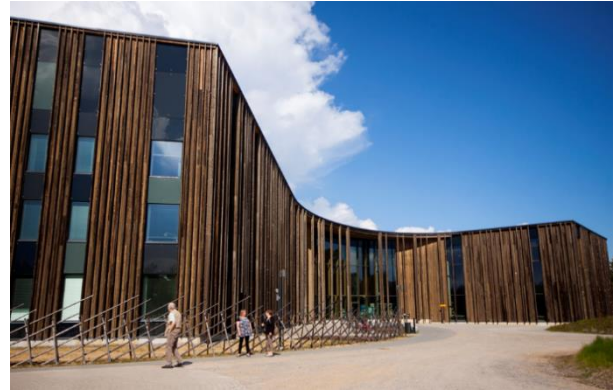
Kuva 3. Saamelaiskulttuurikeskus, Sajos.

Alueiden yksityiskohtaisessa suunnittelussa tulee pyrkiä liikenneturvallisuuteen ja viihtyisyyteen. Alueidenkäytöllä tulee edistää elinkeinoelämän toimintaedellytyksiä varaamalla riittävästi yritystoiminnalle soveltuvia alueita. Niiden sijoittumisessa tulee kiinnittää huomiota olemassa olevien työpaikka-alueiden kehittämismahdollisuuksiin, hyvään saavutettavuuteen ja työpaikkojen sijoittumiseen lähelle asukkaita. Taajama-alueiden yhteys ympäröivään luontoon tulee säilyttää. Erityistä huomiota tulee kiinnittää elinympäristöjen terveellisyyden ja turvallisuuden edistämiseen sekä terveyshaittojen ennalta ehkäisemiseen ja olemassa olevien haittojen poistamiseen.