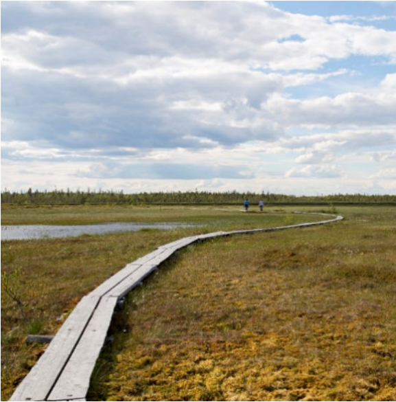
Kuva 4: Aapasuo Sodankylässä

Erityisesti poronhoitoa varten tarkoitetun alueen raja-merkinnällä osoitetaan poronhoitolain 2 §:n 2.mon mukainen erityisen poronhoitoalueen eteläraja.