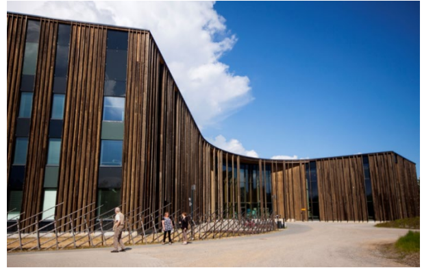
Kuva 3. Saamelaiskulttuurikeskus, Sajos.

Alueiden yksityiskohtaisessa suunnittelussa tulee pyrkiä liikenneturvallisuuteen ja viihtyisyyteen. Alueidenkäytöllä tulee edistää elinkeinoelämän toimintaedellytyksiä varaamalla riittävästi yritystoiminnalle soveltuvia alueita. Niiden sijoittumisessa tulee kiinnittää huomiota olemassa olevien työpaikka-alueiden kehittämismahdollisuuksiin, hyvään saavutettavuuteen ja työpaikkojen sijoittumiseen lähelle asukkaita. Taajama-alueiden yhteys ympäröivään luontoon tulee säilyttää. Erityistä huomiota tulee kiinnittää elinympäristöjen terveellisuuden ja turvallisuuden edistämiseen sekä terveyshaittojen ennalta ehkäisemiseen ja olemassa olevien haittojen poistamiseen.